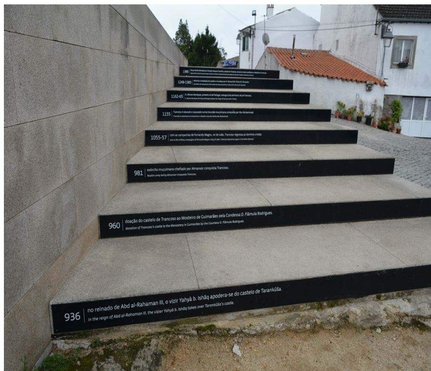
Foto: Castelo de Trancoso

Entre 960 e 1140, o Castelo de Trancoso recebeu diversas ofensivas muçulmanas, até que D. Afonso Henriques começasse a independência de Portugal. Oficialmente, o Castelo de Trancoso é fundado em 1159, e em 1173 doado a Ordem do Templo. Sob a posse da Ordem do Templo, o Castelo de Trancoso enfrentou ataques e invasões castelhanas até por volta de 1398.