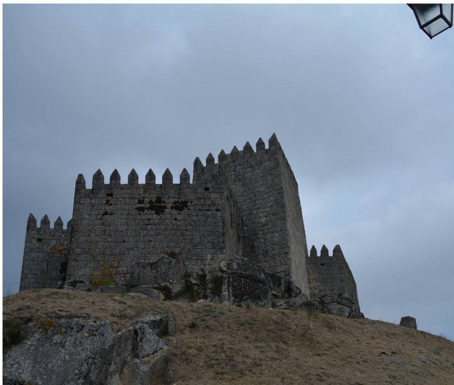
Foto: Castelo de Trancoso

O castelo tem origem declarada entre os séculos VIII-IX e é considerado pelos locais como uma das mais importantes fortificações da Beira Interior Norte de Portugal. A cidade de Trancoso e o castelo possuem diversas “ camadas históricas e categorias meta-históricas ” que remontam, segundo “narrativas locais”, ora a pré-história, ora aos romanos. De qualquer forma, para nosso caso, vamos adotar as camadas “mais medievais”, no Reinado de Abd al-Rahaman III (891-961), califa de Córdoba.