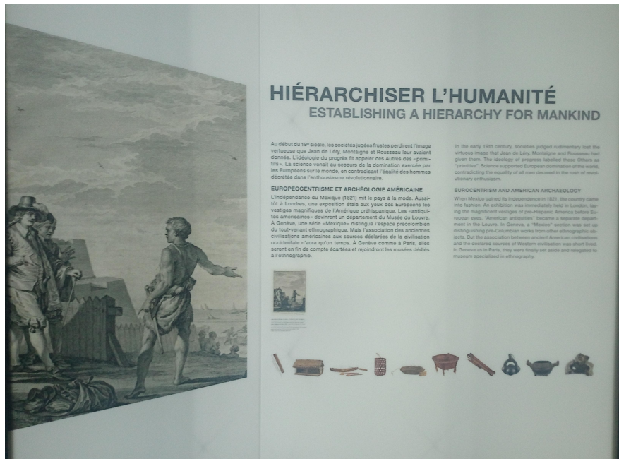
Figura 1 - Painel que integra a seção “Histoire des collections” do

intrínseca com o colonialismo, apresentando tópicos como a hierarquização da humanidade no contexto colonial (Figura 1).