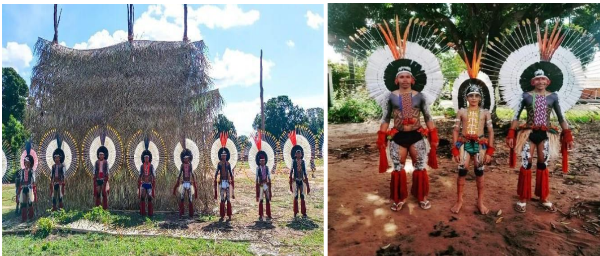
As imagens ilustram parte da festa de Hetohoky , a qual marca a passagem de menino para fase adolescente ( jyre ).