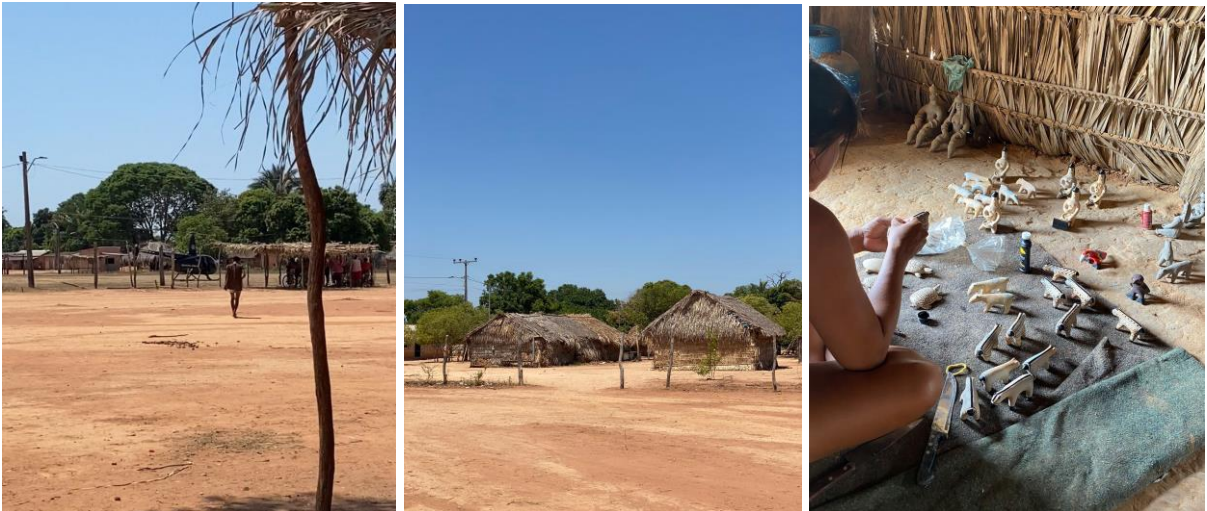
Imagens da Aldeia Santa Isabel e de uma mulher Iny ceramista pintando suas peças.

Espero que esse trabalho tenha tornado visível o quanto as mulheres Iny estão vulneráveis dentro do território em que estão inseridas. Diante disso, eu como mulher indígena e futura profissional de psicologia procurei colaborar na busca de acolhimento dessas mulheres em situação de violência e trazer essa experiência para a academia na forma deste TCC. É de suma importância garantir o bem-estar dessas mulheres, porém dentro das limitações da aldeia, respeitando a cultura Iny e sempre mantendo, em primeiro lugar, a integridade dessas mulheres e a individualidade de cada uma.