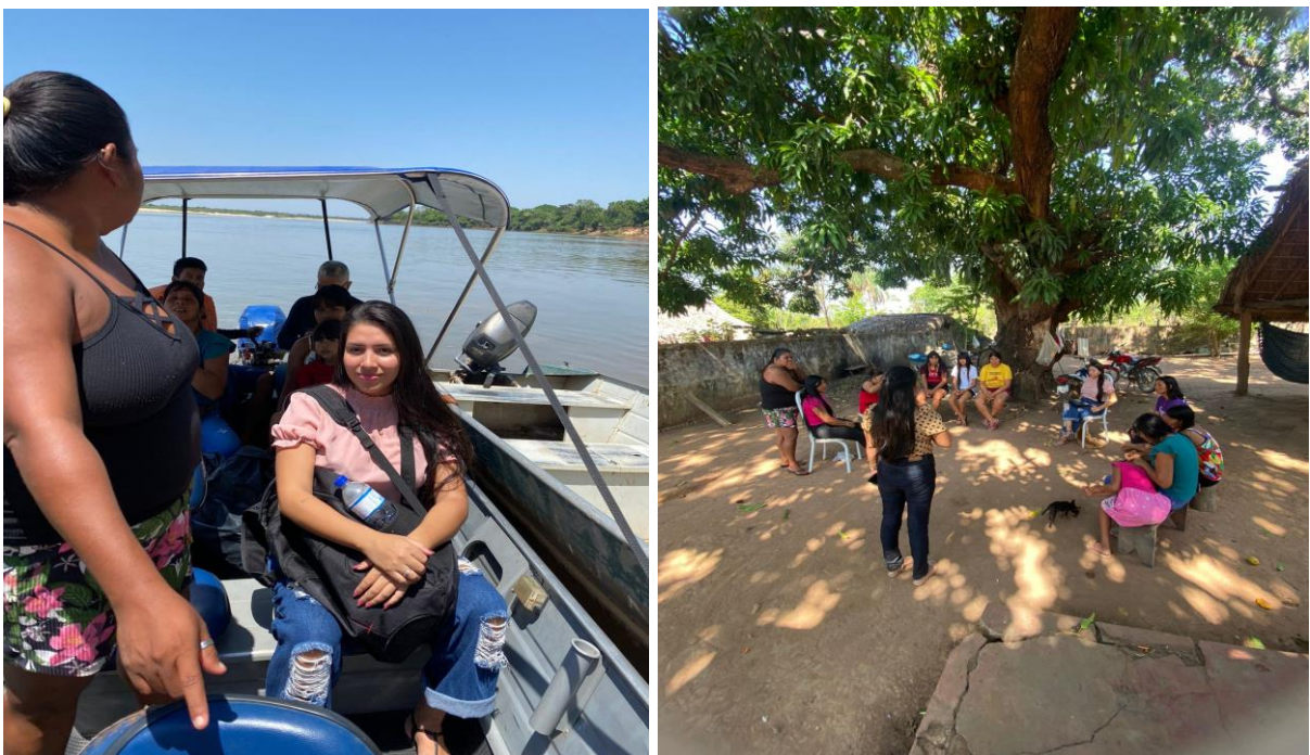
Travessia do Rio Araguaia e registro da Roda de Conversa.