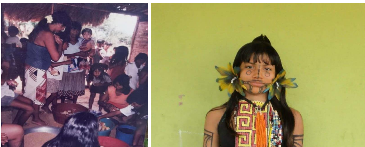
Registro do meu ritual de introdução alimentar e minha foto no ritual de Ijadokoma em 2012.