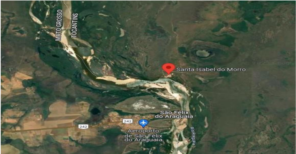
Localização da aldeia Santa Isabel na Ilha do Bananal. Imagens geradas via Google Maps.