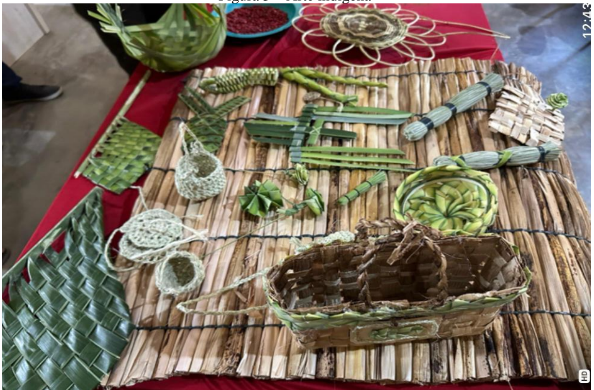
Figura 5 – Arte indígena

Fonte: Acervo de Fernando Henrique (2024).