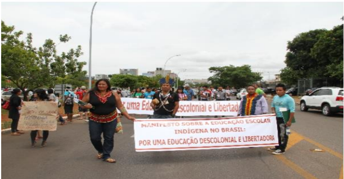
Figura 2 – Manifestação “Educação é um direito, mas tem que ser do nosso jeito

A educação escolar indígena no contexto brasileiro, tem evoluído significativamente, contudo, ainda é permeada por muitos desafios. Garantir uma educação digna e de qualidade para os povos, não se trata apenas da inclusão escolar, é necessário garantir uma formação que certifique as comunidades indígenas o direito de utilizar a sua própria língua e seus próprios processos de aprendizagem na escola (CUNHA JÚNIOR, 2016), como se evidencia no movimento registrado na fotografia abaixo.