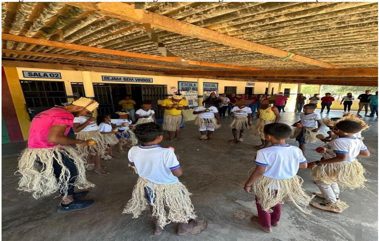
Figura 1 – Estudantes da escola indígena Manoel Miguel do Nascimento dançando o 1 toré