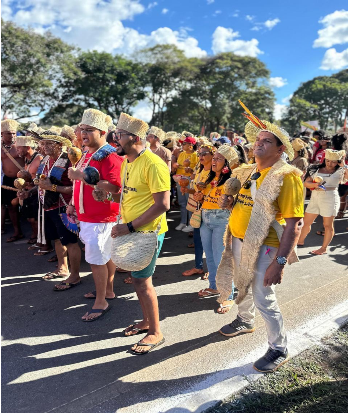
Figura 4 – Povo indígena Pankará no Acampamento Terra Livre (ATL)

Fonte: Acervo pessoal Fernando Henrique (2024)