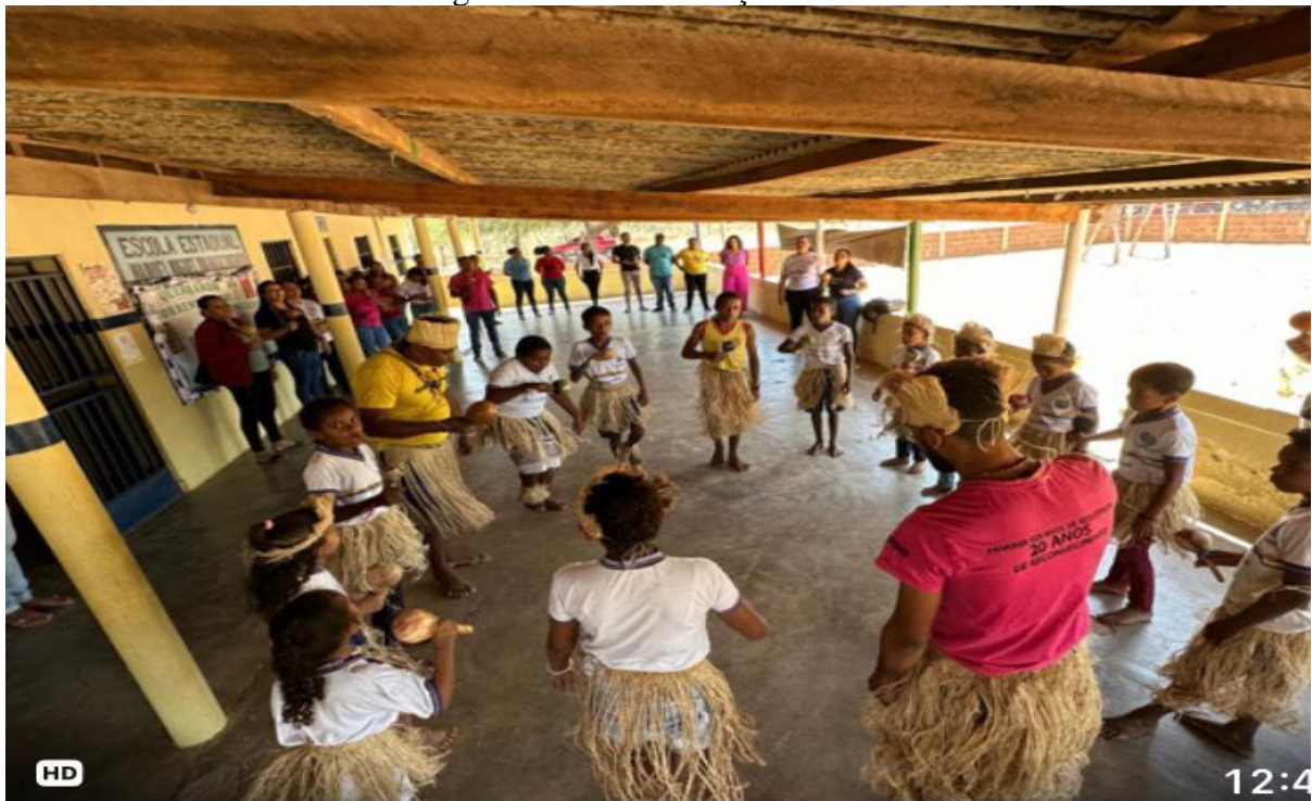
Figura 6 – Alunos dançando Toré