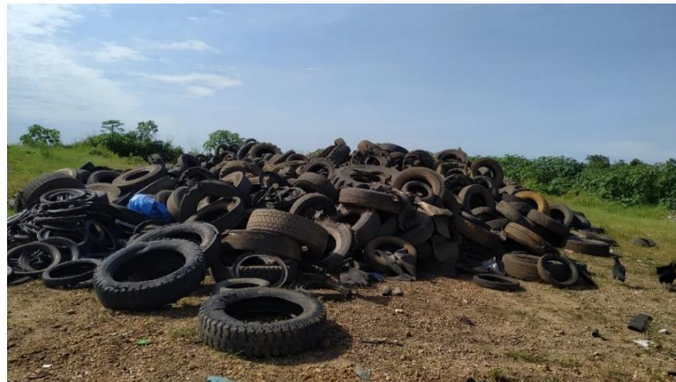
(A) – Pneus inservíveis dispostos de maneira inadequada no lixão municipal.