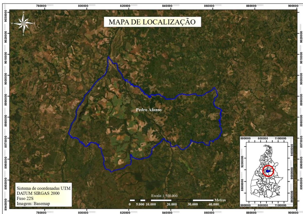
Figura 1: Mapa da localização do Município de Pedro Afonso – TO.

O município teve um grande destaque quanto à produção agropecuária de soja, arroz (SEPLAN, 2017) e se destacando principalmente na produção de cana-de-açúcar, na safra de 2017/2018 registrou 2.187 mil toneladas (SEPLAN, 2017; TOCANTINS, s.d).