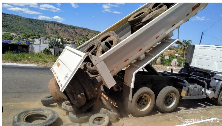
(B) – Entrega dos pneus no Eco ponto do município de Paraíso do Tocantins-TO.