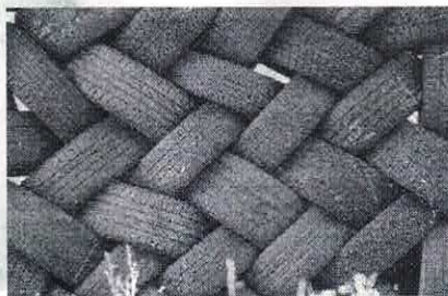
Forma correta de disposição dos pneus

Sem mais nada para o momento ressalto estima e consideração.