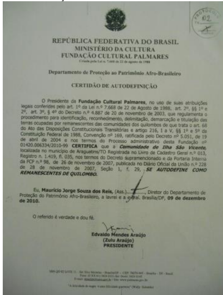
Figura 4 - Certidão de Autodefinição da comunidade quilombola da Ilha São Vicente emitido pela Fundação Cultural Palmares

A Certidão de Autodefinição da Comunidade Quilombola da Ilha de São Vicente, cedida pelos moradores, informa que as famílias se autodefinem como remanescentes de quilombo. O documento dá legitimidade aos fatos já narrados pelas famílias da comunidade. Os remanescentes agora lutam pelo processo de titulação da terra.