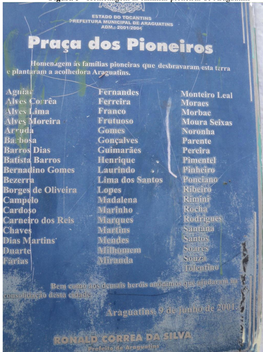
Figura 3 - Homenagem às famílias pioneiras de Araguatins

pioneiras da cidade em uma placa de junho de 2001. A família Batista Barros, pertencente à comunidade quilombola da Ilha de São Vicente está presente na oitava linha.