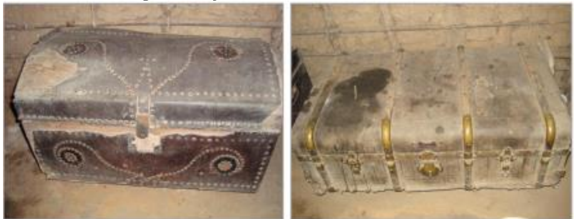
Figura 2 - Objetos históricos da comunidade