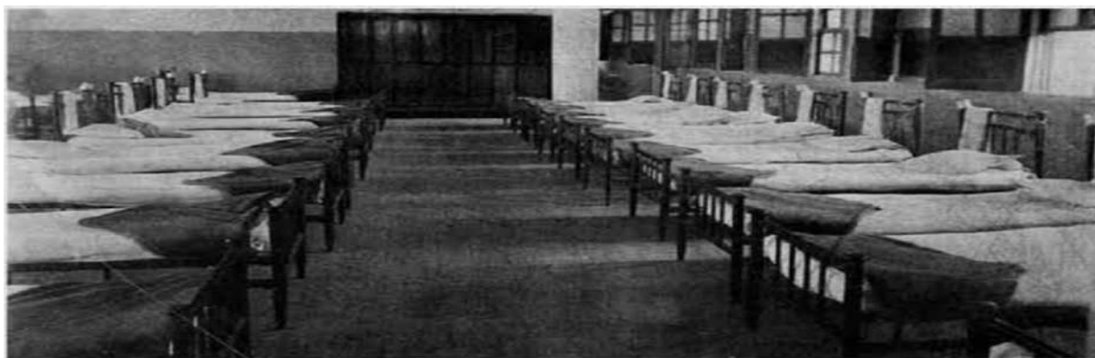
Figura 2. Foto dos Dormitório do Preventório Afrânio de Azevedo em Goiás.

Os preventórios nos tipos que arquitetamos são de construções de preços acessíveis às próprias associações particulares. Os preventórios devem ser construídos em dois ou três pavilhões ou quantos forem necessários para abrigar os menores. Os pavilhões devem ser divididos em duas seções: masculina e feminina. Podem ser retangulares ou quadrangulares, adaptados de apartamentos necessários, como: cozinha, copa, dispensa; com instalações sanitárias adequadas. Junto aos pavilhões deve haver galpões para recreios e ao mesmo tempo adaptáveis para pequenas oficinas, como sejam: de vassouras, escovas, espanadores, etc. Uma escola primária seria criada e mantida pelo governo estadual, em cada preventório. Teriam terreno suficiente para plantações de hortaliças, para o custeio dos mesmos, e para a aprendizagem da sericultura. Um preventório nas condições acima não fica em mais do que 20 contos de reis.