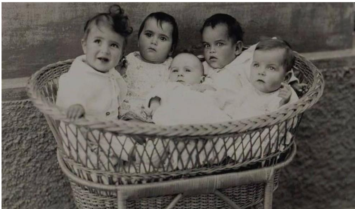
Figura 1. Imagens de bebês filhos de pais hansenianos e encaminhados ao preventório. 2

O presente artigo tem como preocupação discutir aspectos sobre a alienação parental de filhos de hansenianos, forçada por políticas governamentais no Brasil no período de 1943 a 1986. A escolha dessa temporalidade, se dá em detrimento que este período foi o início e o fim da internação compulsória 1 de filhos de hansenianos nos preventórios (espaços físicos onde eram levadas estas crianças).