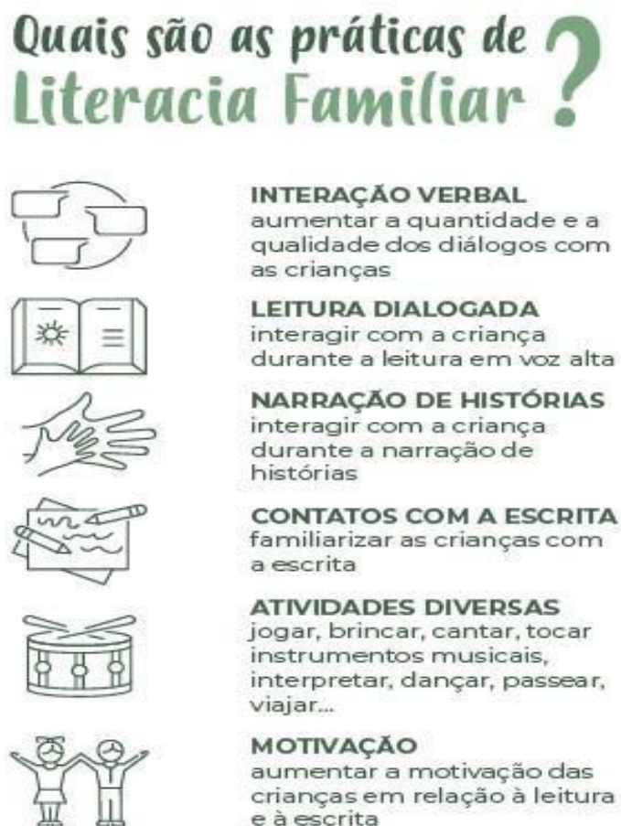
Figura 4 – Práticas de Literacia Familiar