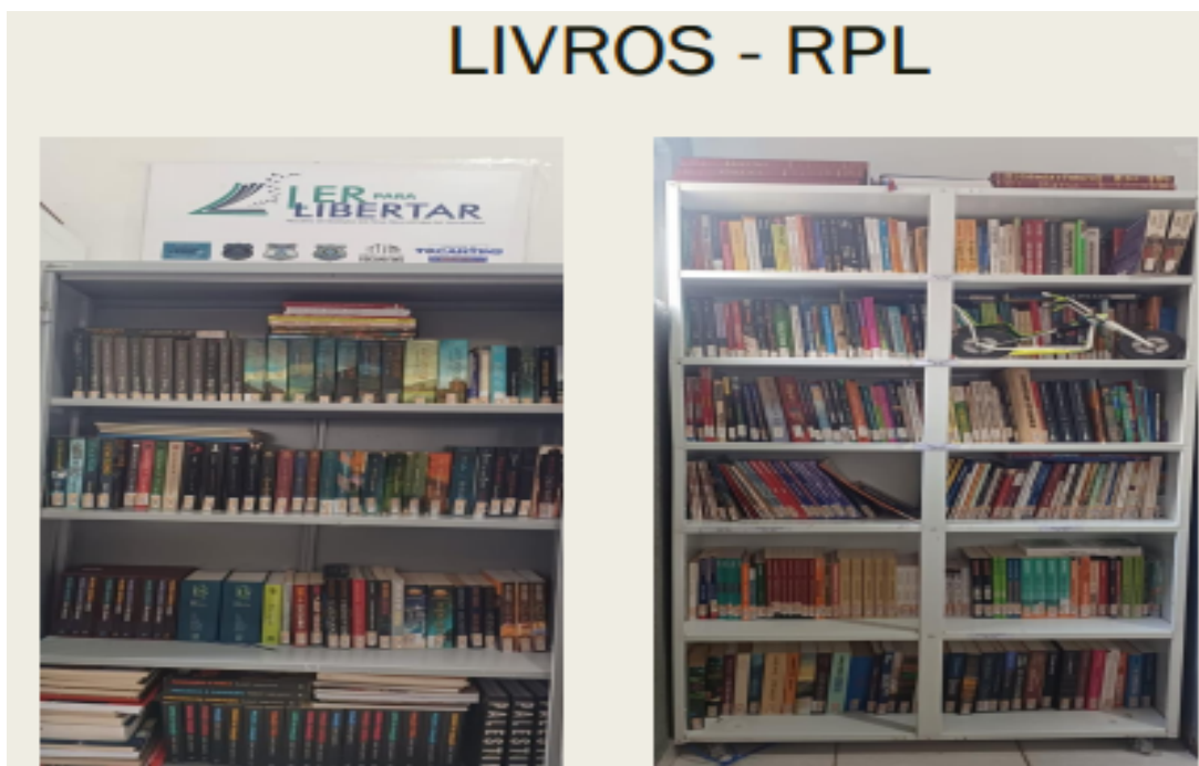
Figura 01- Foto do acervo bibliográfico da RPL UP-Arraias

Segundo dados da execução da RPL na Unidade Penal de Arraias, ainda não há uma biblioteca na UP, os livros são armazenados em prateleiras em uma pequena sala dividida com a assistência social e com o projeto de remição de pena pela leitura.