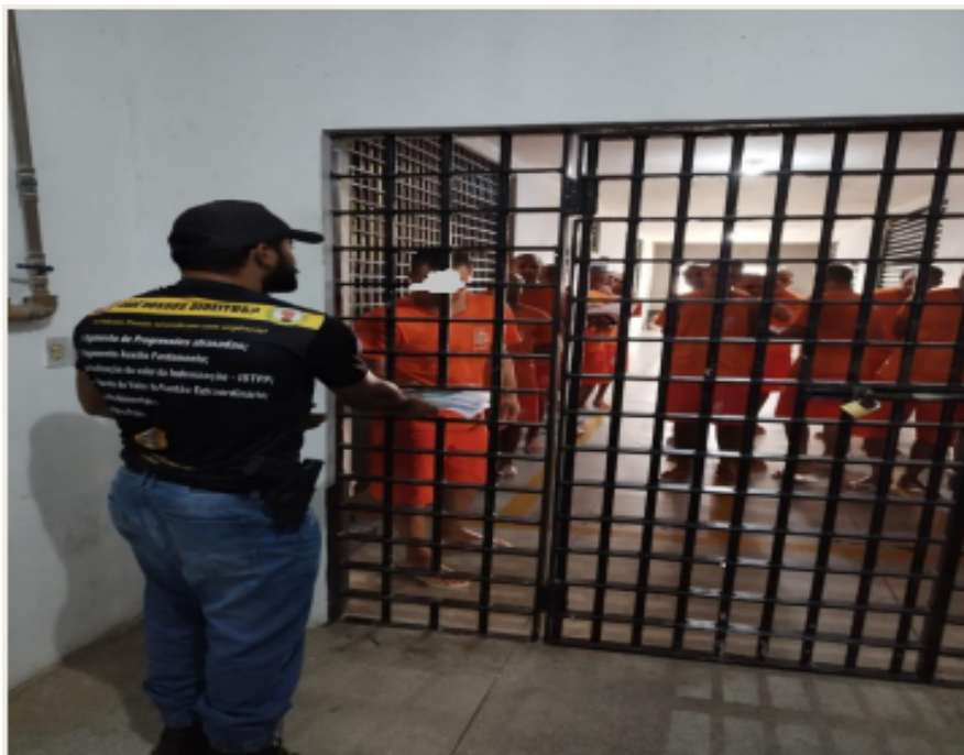
Figura 03 - Entrega dos livros aos reeducandos da RPL.