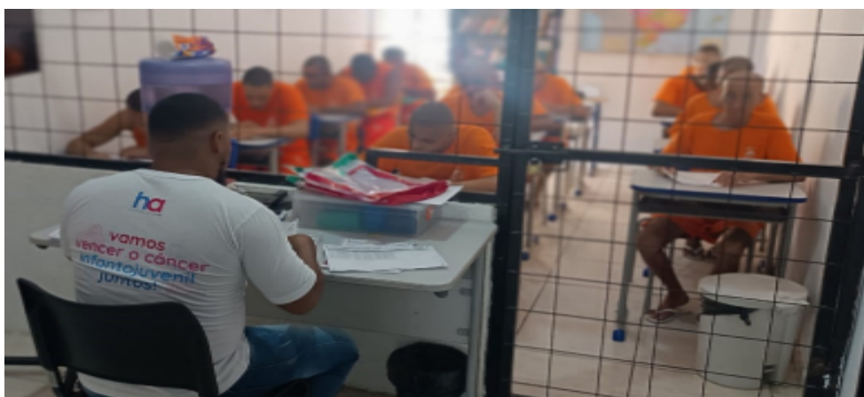
Figura 04 - Foto do momento realização do relatório/resenha

Na quinta etapa, é realizada a produção de relatório/resenha das obras lidas, as produções são realizadas individualmente e em sala de aula e com a presença de pelo 01 (um) membro da CVRPL de acordo com o projeto de execução da RPL, e demonstrado nas figuras 04 e 05.