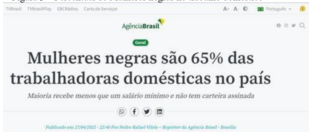
Figura 3 – Percentual de Mulheres negras no trabalho doméstico

Na figura 2 está o resultado das discussões sobre as principais dimensões que envolvem as mulheres negras que são as mais submetidas ao trabalho doméstico (figura 3), e decorre que em todos os entrelaces das dimensões (interseccionalidade), todas elas resultam e submetem as mulheres negras as relações de desigualdades na atualidade, não rompendo com o modo de exploração da escravidão.