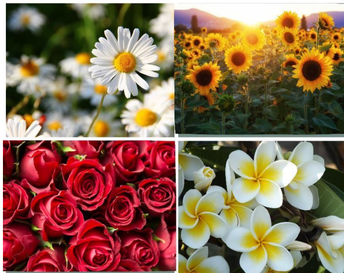
Figura 4 – Montagem com fotos sobre as flores codinomes das mulheres