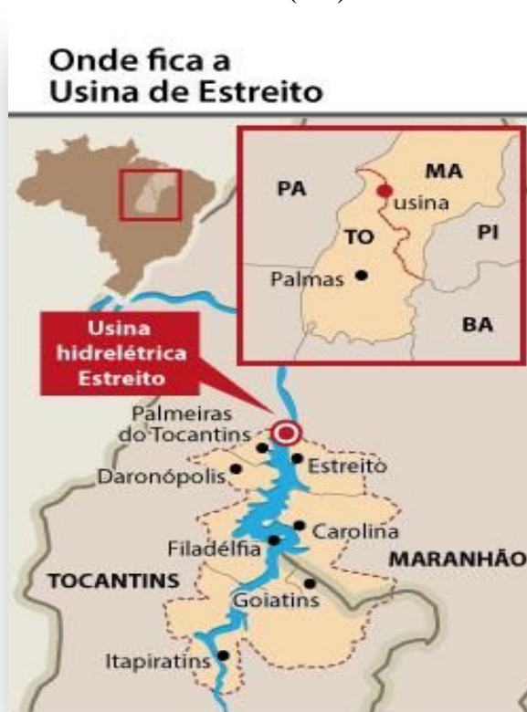
Mapa 3. Localização da Usina Hidrelétrica de Estreito (MA)

Além das comunidades, 12 municípios foram atingidos diretamente, dez no estado do Tocantins que são eles: Aguiarnópolis, Palmeiras, Darcinópolis, Babaçulândia, Filadélfia, Barra do Ouro, Palmeirante, Wanderlândia, Tupiratins e Itapiratins, e dois municípios no Maranhão, sendo: Carolina e Estreito, que tiveram parte de suas áreas inundadas e ainda boa parte de suas infraestruturas ficarão comprometidas.