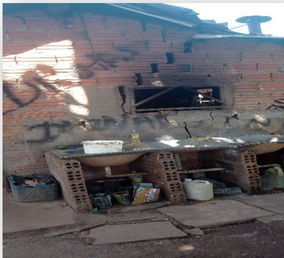
Imagem 3. Residência em área de risco com grandes rachaduras.