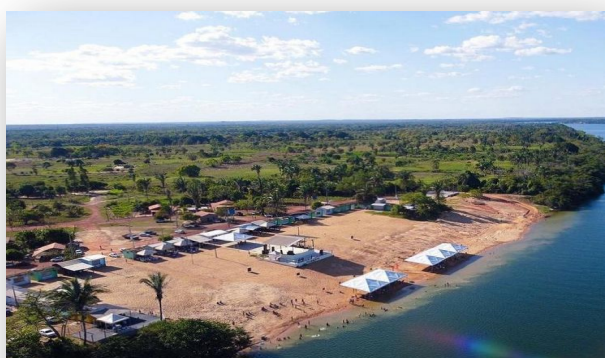
Imagem 5. Imagem da praia artificial atualmente