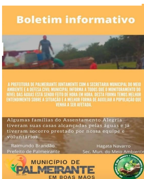
Figura 2. Boletim informativo sobre o monitoramento das águas.