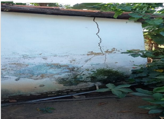
Imagem 1. Residência de um dos entrevistados com grandes rachaduras.