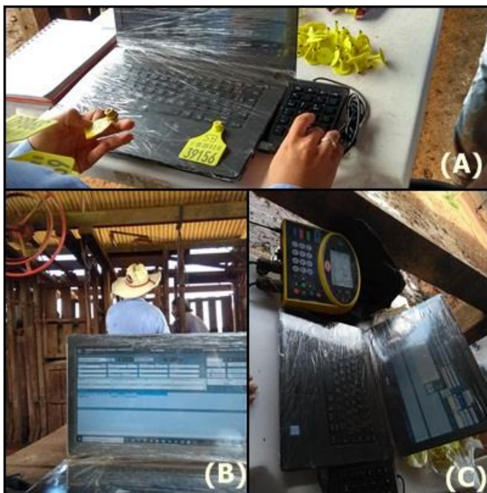
Figura 4. Utilização de Software e brincagem na desmama (A), acompanhamento com software na Inseminação artificial (B), utilização do software na desmama e pesagem (C).

Fonte: Cruz, M. B. AgroSB, São Felix do Xingu, março 2019.