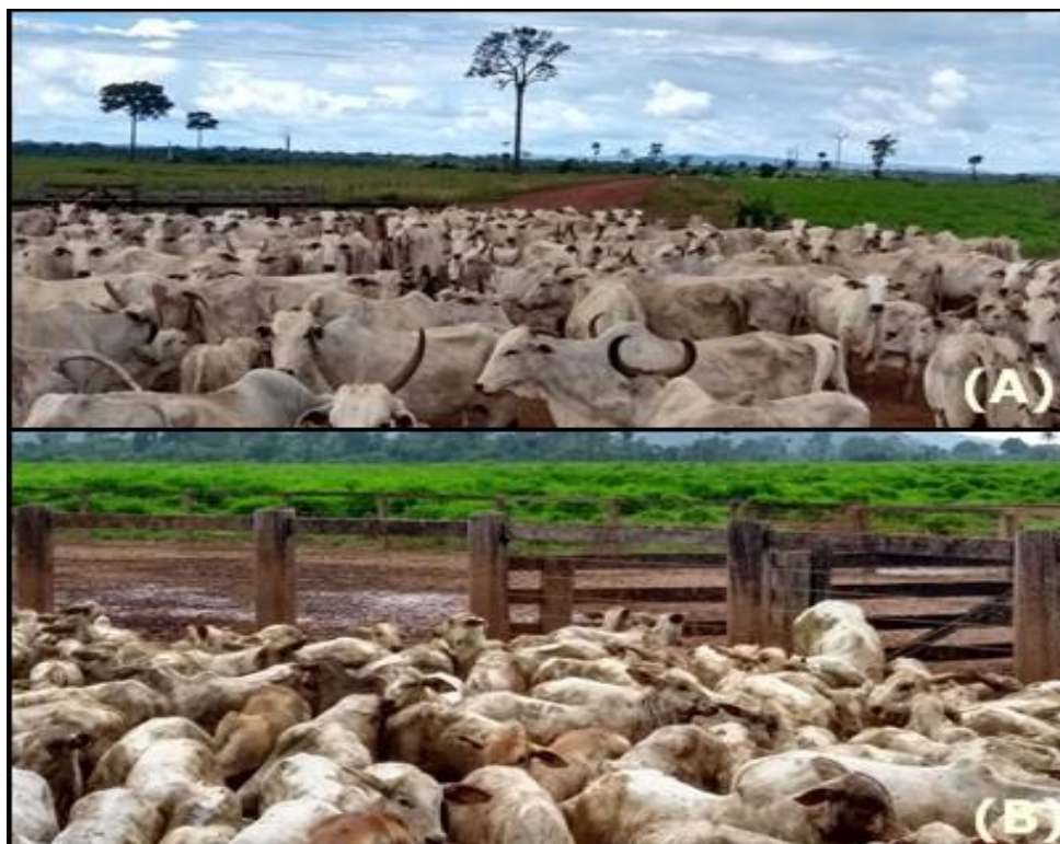
Figura 12. Vacas e Bezerros após apartação na desmama.