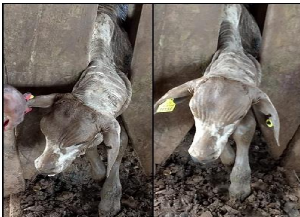
Figura 9- Bezerros com brinco e chip

No 4º mês, por ocasião do manejo da 1ª dose da vacina de clostridiose, o capataz concluirá a segunda etapa do registro de cada animal, com os seguintes procedimentos: Fêmea, o brinco menor será substituído por um brinco padrão. E o macho, o brinco menor permanecerá até a sua venda ou abate. Em ambos os sexos eram fixados os bottons que é o “chip” (dispositivo de armazenagem de dados) fixado na orelha esquerda do animal que permite sua identificação a partir de um leitor eletrônico na orelha esquerda. Esse manejo é de extrema importância dentro da propriedade para o controle do animal. O assistente de pecuária juntamente com o computador, utilizando o software multibovinos preenche informações dos animais, para um maior controle dos animais ao longo da sua vida. Esses animais são levados ao curral e separados de sua mãe para serem feitos os procedimentos.