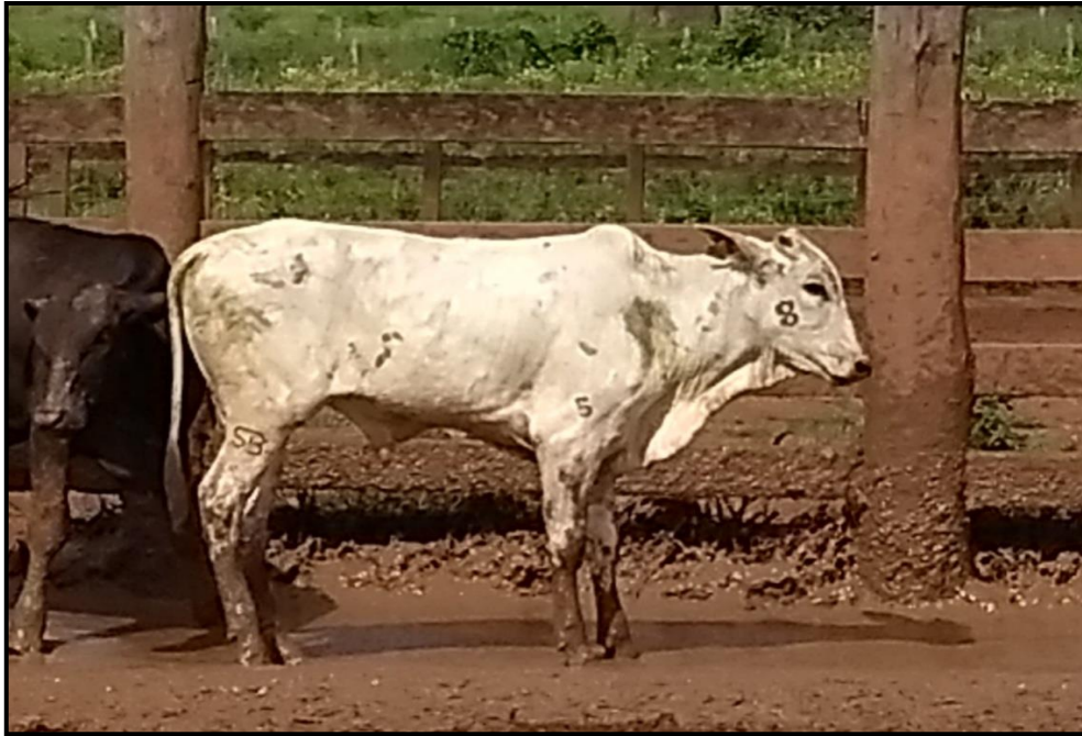
Figura 10. Bezerro com marcação a fogo