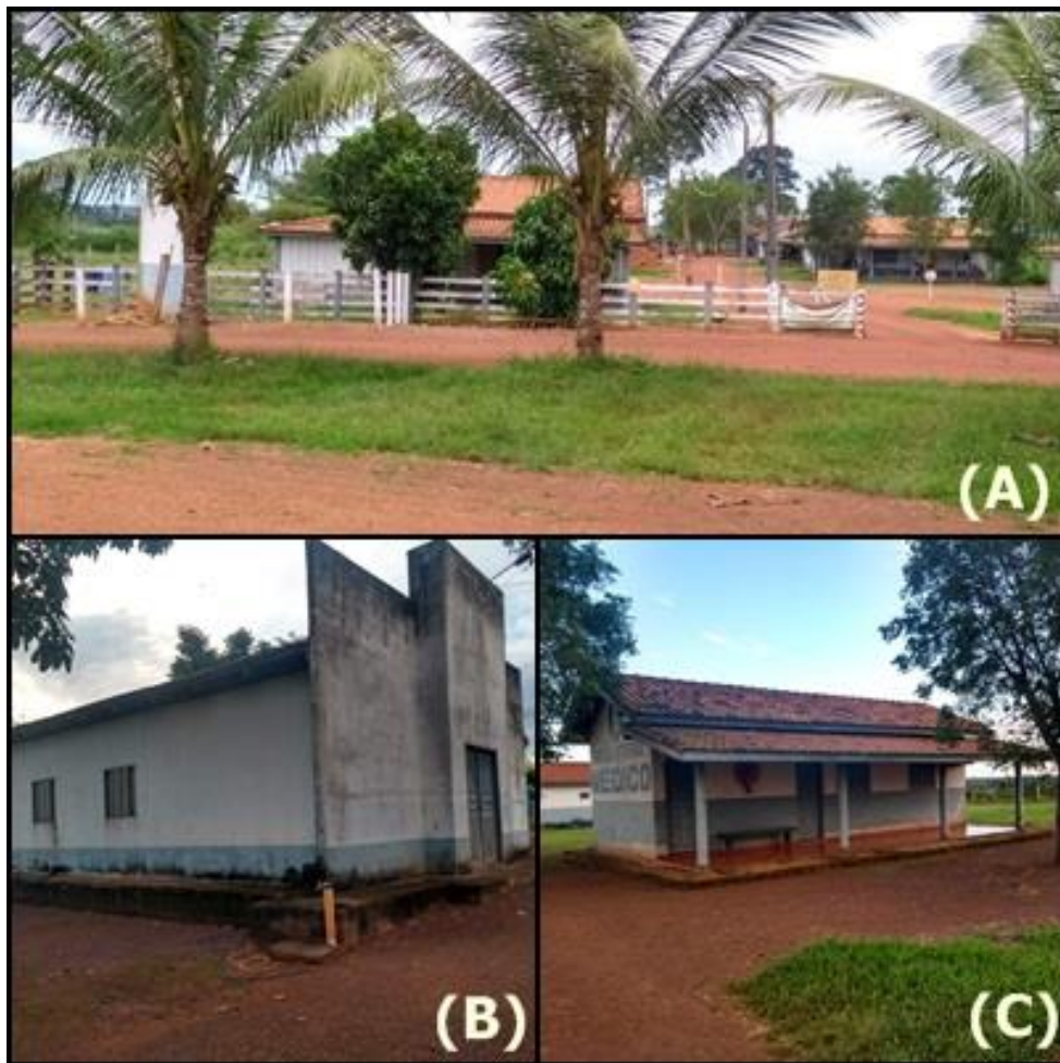
Figura 3. Entrada da sede do escritório Lagoa do Triunfo (A), Igreja (B), Ambulatório medico (C).