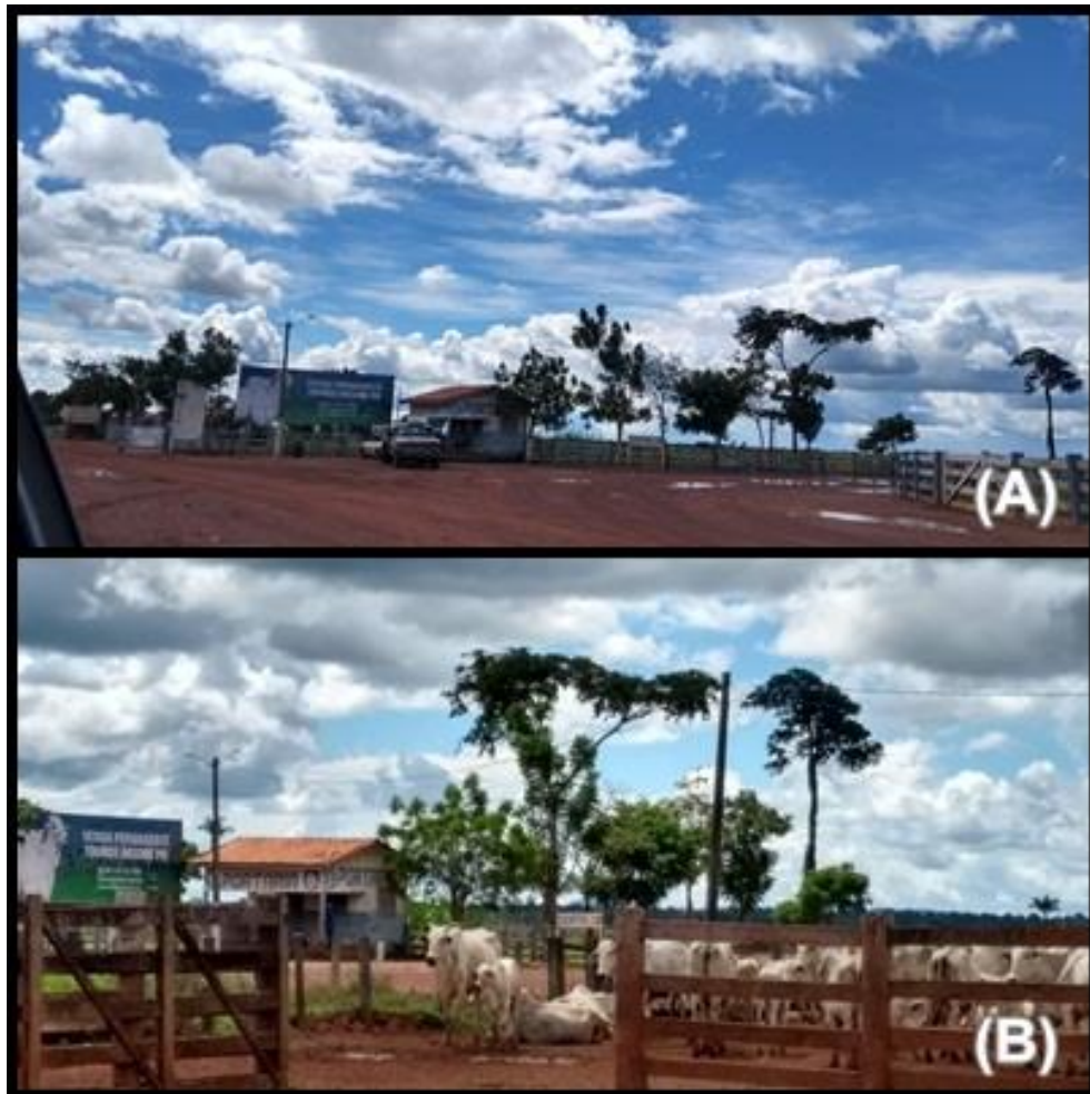
Figura 2. Entrada da fazenda Lagoa do Triunfo, AgroSB.