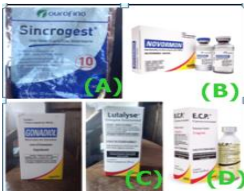
Figura 5 - A) SINCROGEST® (Implante de progesterona) B) NOVORMON® (Análogo do GnRH) C) GONADIOL® (Benzoato de Estradiol) LUTALYSE® (Dinoprost Trometamina) D) E.C.P. (Cipronato de Estradiol) Material utilizado para o protocolo de Inseminação Artificial em Tempo Fixo na Fazenda Lagoa do Triunfo – PA.