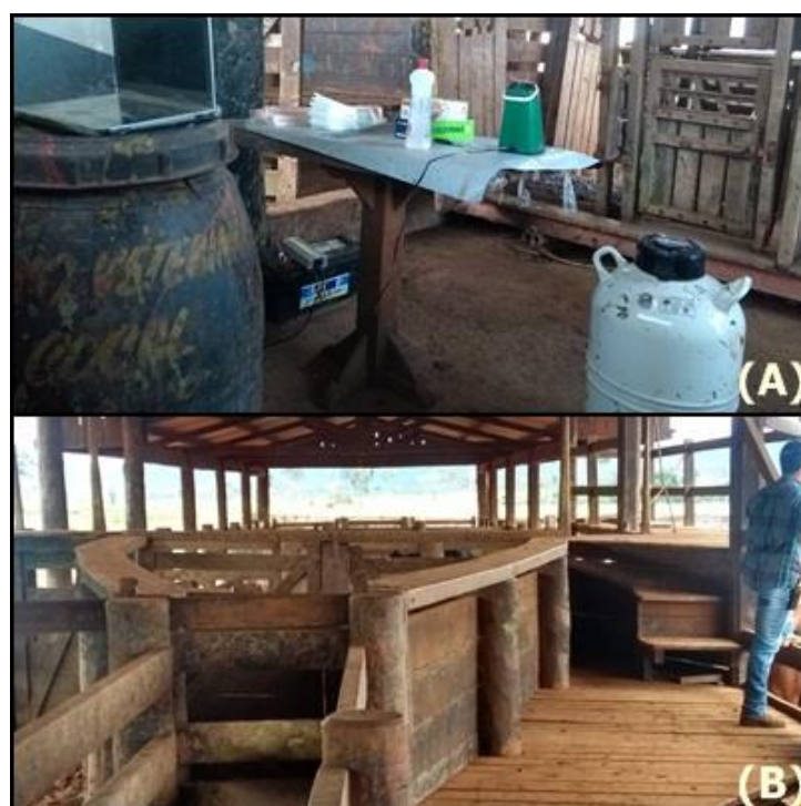
Figura 6. Centro de manejo-currais (A B), curral preparado para inseminação (A).